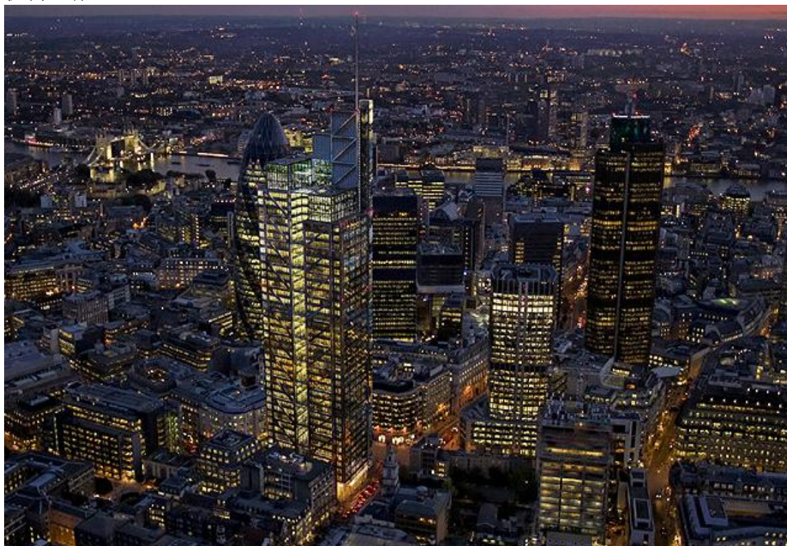
伦敦金融城夜景（图正中最高建筑为 City Credit 刚迁入之新办公楼 Heron Tower）

这是英国金融衍生品提供商首次获得 CISI 的授权和许可，在英国海外地区结合 City Credit 自身的金融实践操作规范，推广和宣传 CISI 的标准和理念；同时，City Credit 也是目前唯一一家受英国金融服务管理局(FSA)监管的商业机构能够同时代表 CISI 处理英国海外考生和学员的登记和考试报名，并提供协调联合培训以及提供附英实习机会。合格的优秀人员将有机会在 City Credit 推荐下进入相关的金融机构工作。